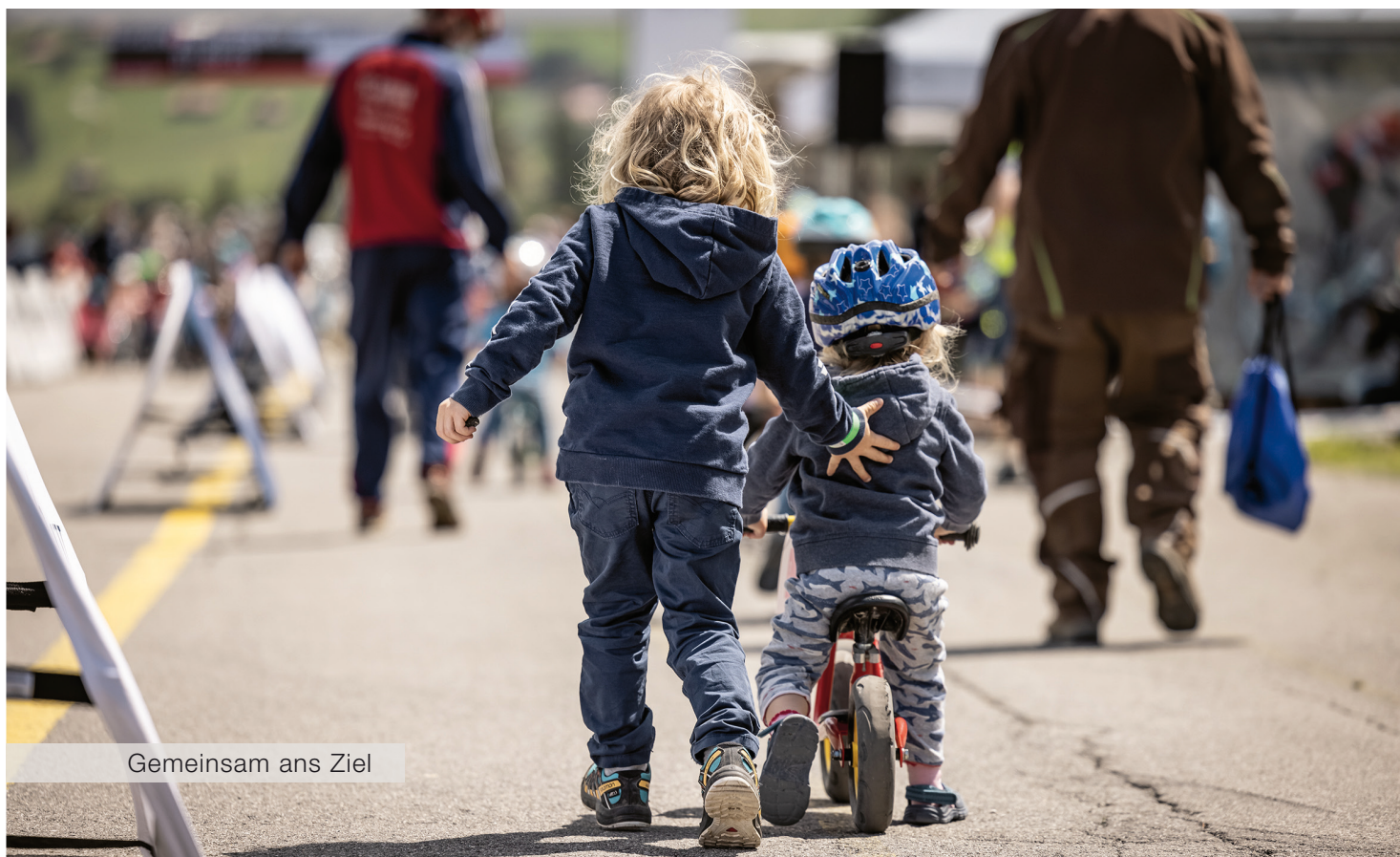
Gemeinsam ans Ziel

Direkt im Anschluss wurde die Rangverkündigung durchgeführt. Alle Kinder bekamen als Mitmachpreis eine Trinkflasche überreicht und die drei Erstplatzierten jeder Kategorie durften sich zusätzlich über eine Stirnlampe freuen. Beim Gruppenfoto wurde eifrig gejubelt und gehüpft – egal welche Platzierung belegt wurde.